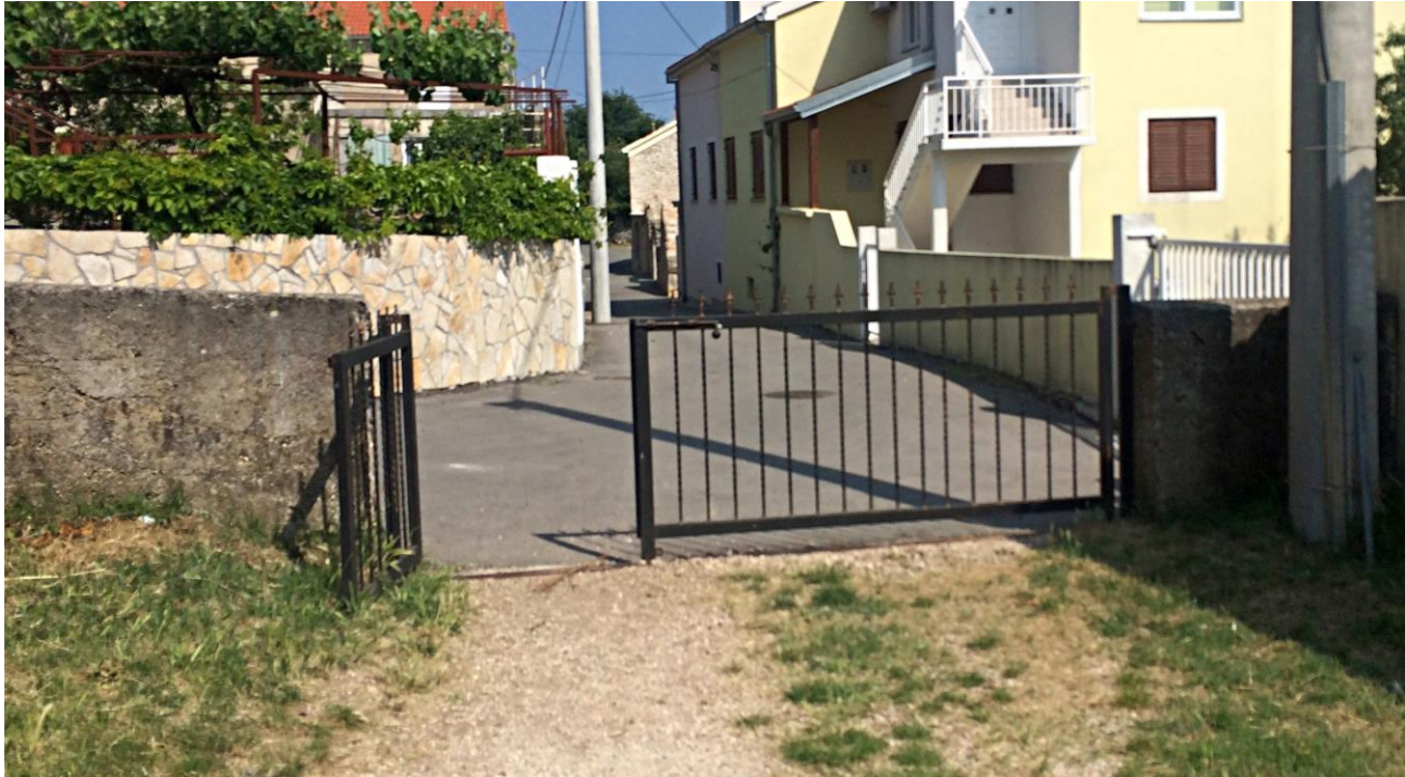
Slika 2. Drugi ulaz utvrde Gradina sa Sjeverne strane – ulaz za vozila

Druga lokacija – CENTAR ZA POSJETITELJE (zgrada bivšeg kina) u centru Drniša na adresi Lovački trg Ova lokacija bi bila ujedno i glavna lokacija u kojoj bi se nalazilo osim sustava za brojanje posjetitelja i klijentsko računalo kojim bi se po potrebi prikupljali podaci sa preostale 3 lokacije.