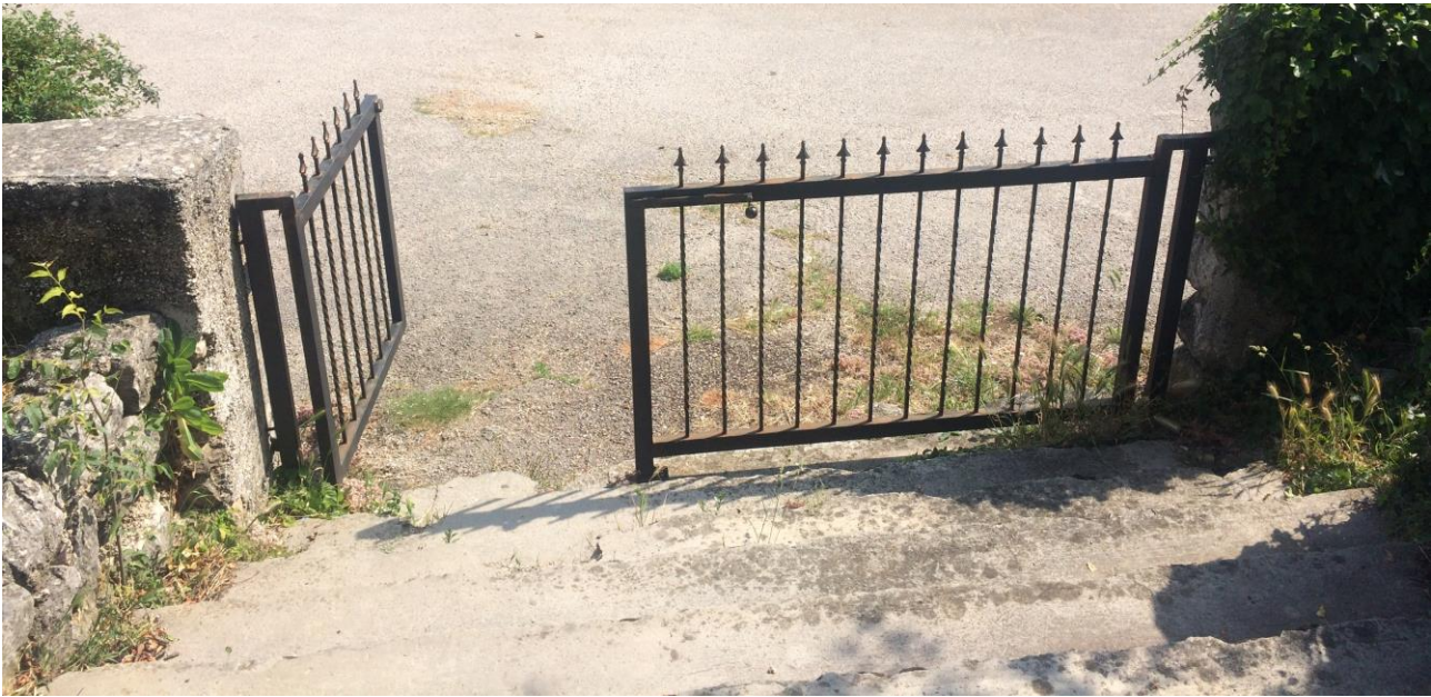
Slika 1. Prvi ulaz, stepenice sa Istočne strane

Nad oba ulaza će se vršiti praćenje broja posjetitelja.