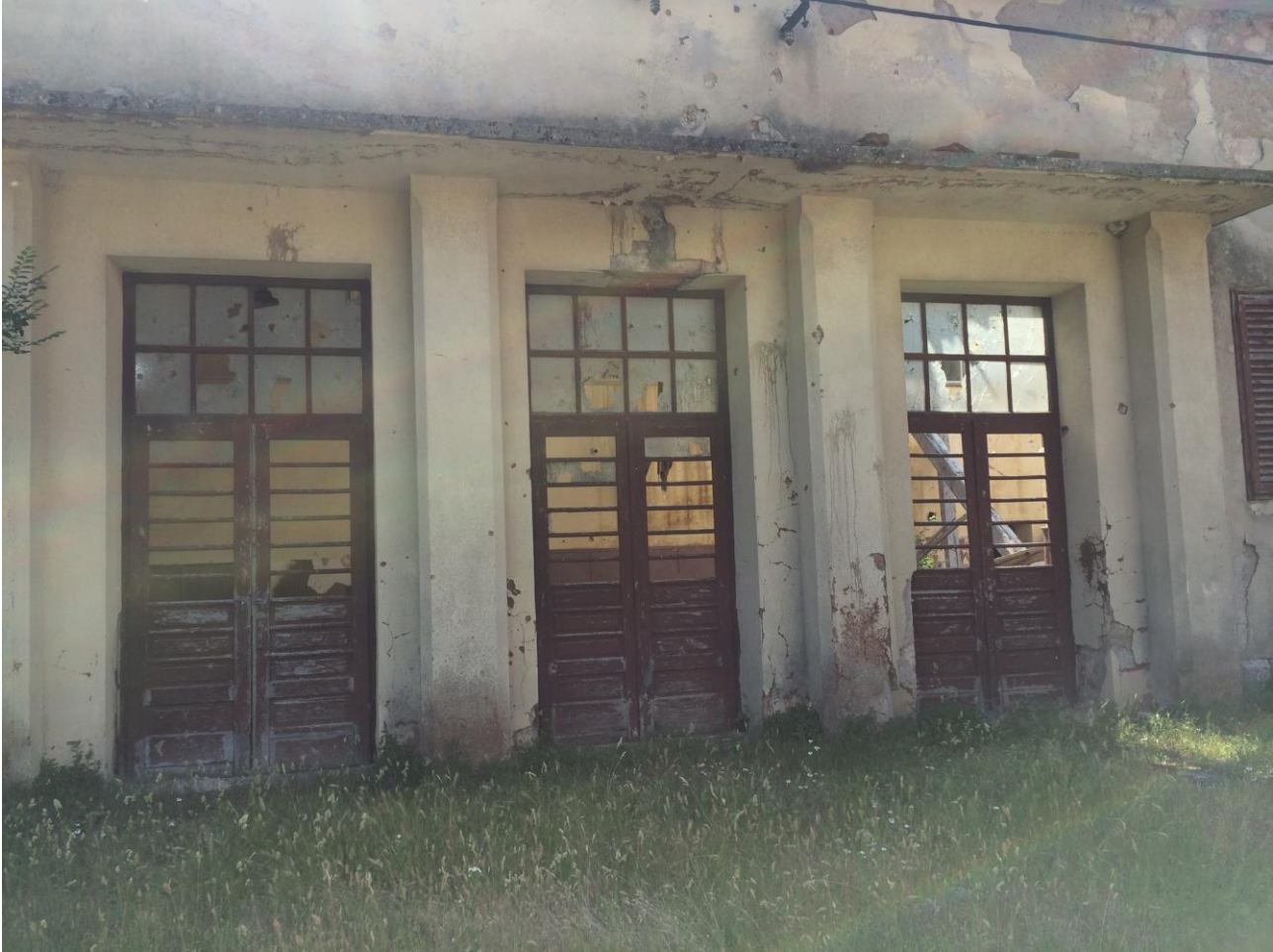
Slika 4. Muzej rudarstva, zgrada bivšeg Doma kulture – sjeverna strana sa tri ulaza