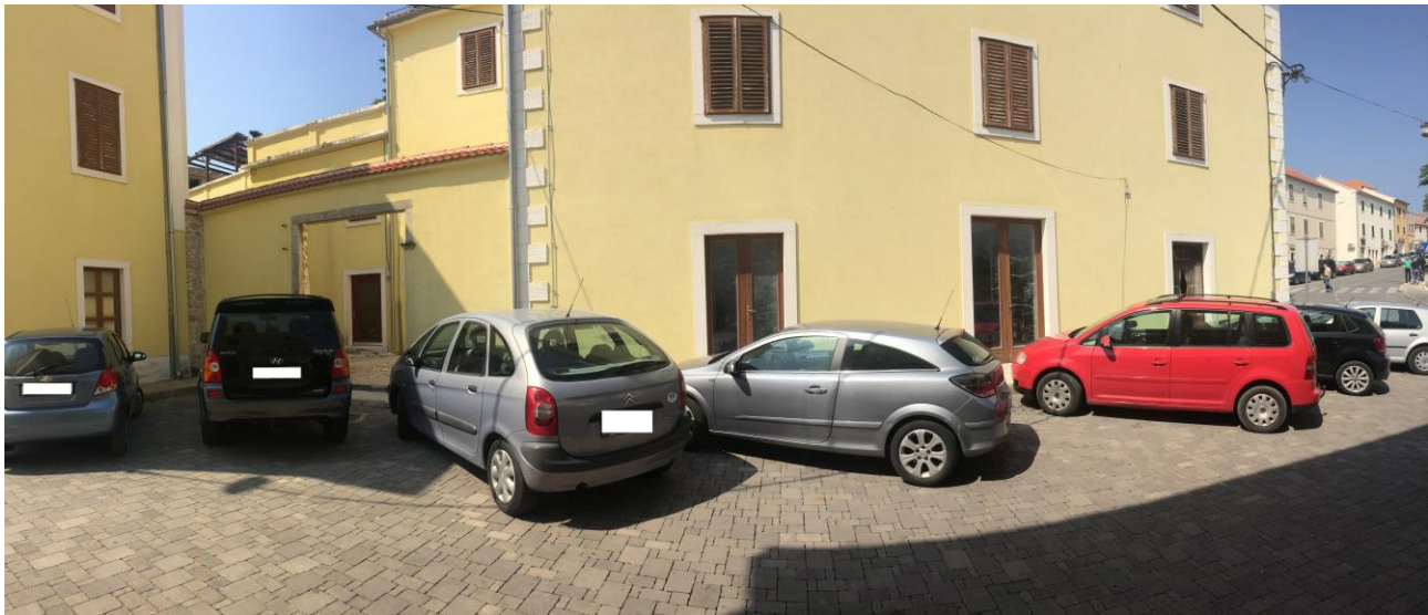
Slika 5. Hostel u sklopu kuće Divnić (poznatije kao bivši Đački dom) južna strana

Četvrta lokacija – Hostel u sklopu kuće Divnić (poznatije kao bivši Đački dom) – nalazi se u centru povijesne jezgre grada Drniša, na adresi Ulica prilaz pošti b.b. Samo bi se jedna vrata koristila (ulaz sa južne strane) za ulaz/izlaz.