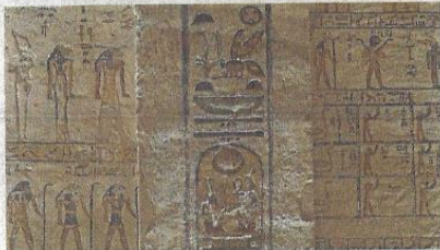
Dešifriranje hijeroglifa označilo je rođenje nove znanosti - egiptologije