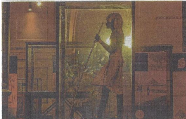
Odgonetnuti hijeroglifne značilo je odgonetnuti povijest drevnog Egipta

Zadatak kustosice Isabel MacDonald je težak jer je mu-