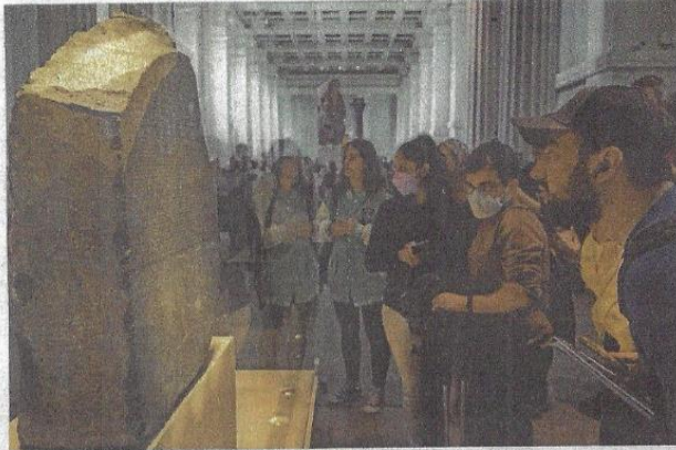
Kamen iz Rosette predmet je trajnih trenja između Egipta i Velike Britanije