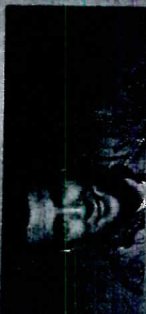
Željko Joksimović - 30.7.