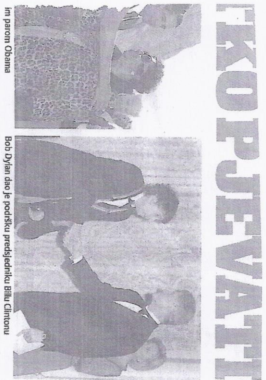
Bob Dylan dno je podrišku predsjedniku Billu Clintonu im parom Obama